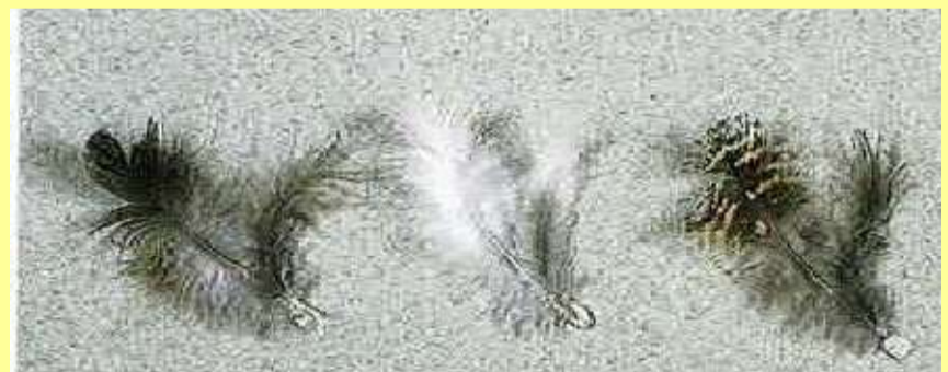
空気を蓄え、断熱効果を高めています。