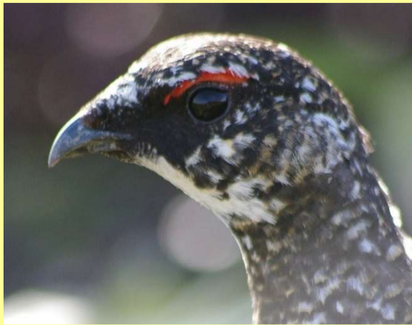
通常時は、レッドアイシャドウ！