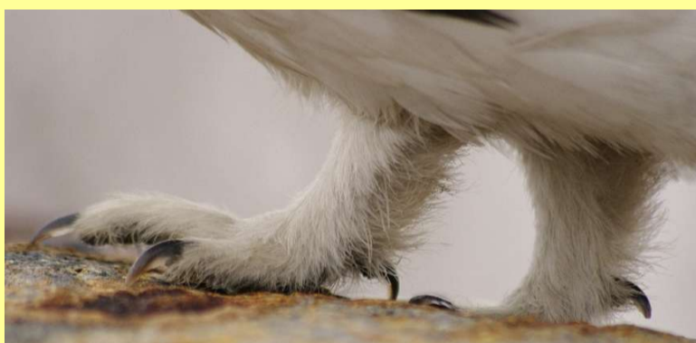
足指にも、毛がびっしり生えています。4本の指先には、鋭いツメもあります。