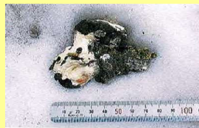
抱卵糞（抱卵中に我慢していたメスの大きなフン）