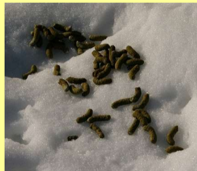
ペレット状のフン