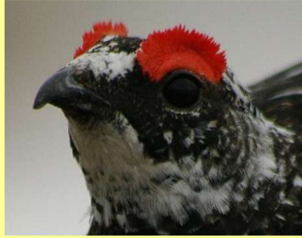
警戒・興奮時は、肉冠が飛び出てきます。