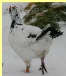
尾羽を上げて、お尻をフリフリと振って、急いで歩く姿は、とてもかわいいです。