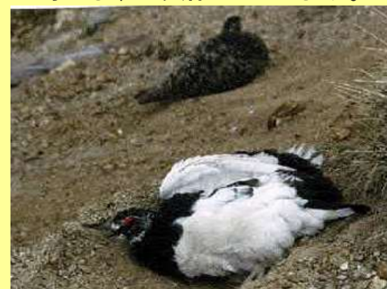
羽毛につく寄生虫を砂浴びで落とします。（春先は、雪浴びもよくします。）