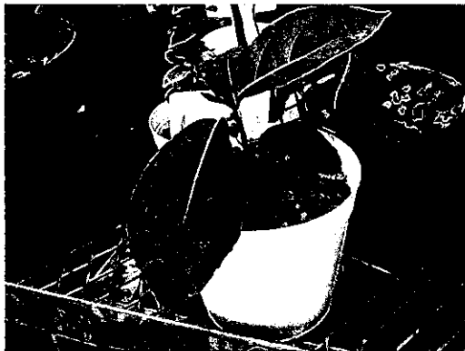
Fig. 4. Ficus septica germinated from the sole soil.

と推察された。トマトの種子は立山(横畑 2006)や尾瀬(瀧野 2004)でも捕捉されていることから、弁当の野菜やフルーツの種子の入っているものは取り扱いに注意する必要がある。