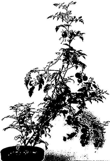
Fig. 3. A cherry tomato germinated from the sole soil.