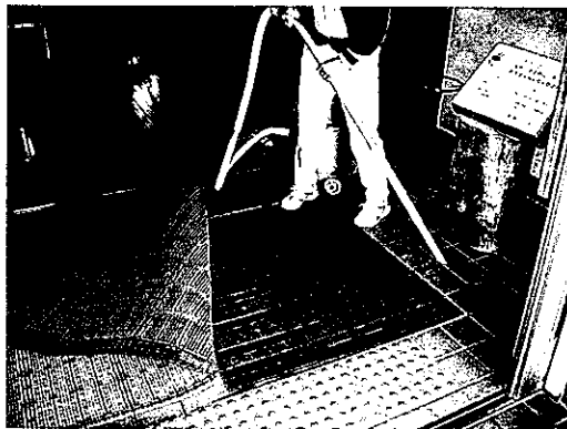
Fig. 1. Collecting the sole soil from the doormat by a cleaner at the Tateyama Nature Conservation Center.

2006 年 8 月以降に立山自然保護センター 3 階の出入口に設置されているマット（幅 257cm×奥行き 121cm×厚さ 3cm）に落とされた入館者の靴底についた土は、2007 年 6 月 10 日に掃除機で吸い取り（Fig. 1）、ビニール袋に入れておよそ 1 ヶ月間冷蔵庫（約 5℃）で